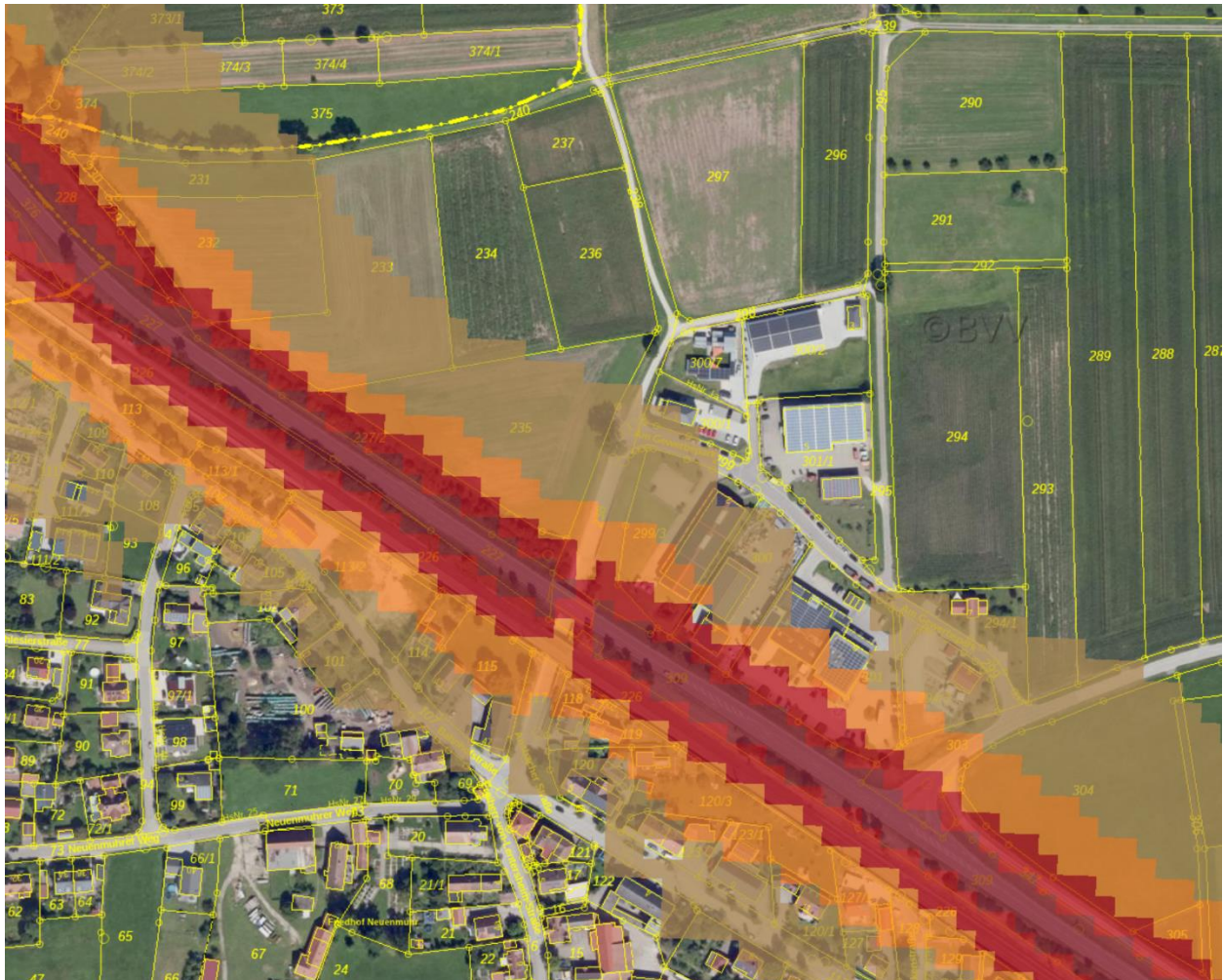
Luftbild mit Flurstücken und Darstellung Lärmausbreitung B13 in Nachtzeitraum: Braun = Belastungen von 55 – 50 dB; Orange = Belastungen von 60 – 65 dB; Rot = Belastungen von 65 – 60 dB; Dunkelrot = Belastungen 70 – 65 dB

Nachstehende unmaßstäbliche Abbildung zeigt orientierend die möglichen Immissionsbelastungen im Nachtzeitraum (22.00 Uhr – 06.00 Uhr) aus dem Verkehrslärm der Bundesstraße B13 im Plangebiet und den überplanten Flächen.