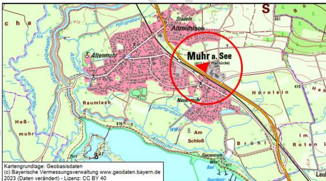
Karte mit Darstellung der Lage des Planungsgebietes

Das Planungsgebiet befindet sich am Ostrand von Muhr am See und grenzt dort an die bestehenden bereits gewerblich genutzten Flächen an.